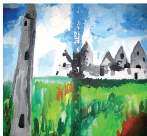
Igor Mojak. kl. II a. Blackrock