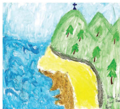
Paweł Nowak. kl.II a. Blackrock