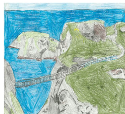
Maja Kanclerz. kl.III c. Blackrock