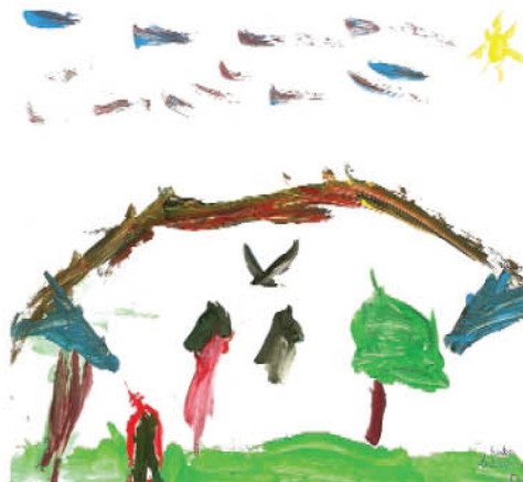
Kuba Łukasiewicz. kl 1 b. Navan Rd