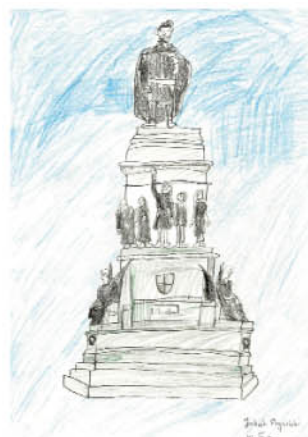
Jakub Pryciński. kl.IIIa. Blackrock