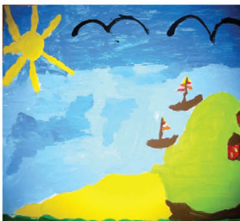
Emilka Nordvind. kl. 2 b. Szkoła SEN Navan Rd.