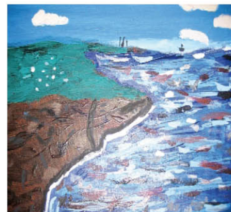
Kamila Mura. kl. V a. Blackrock