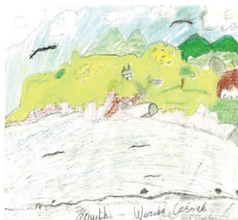
Weronika Leniak. kl.IIIc. Blackrock