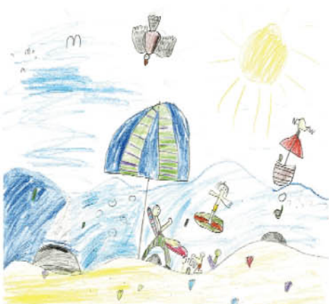
Maciej Owczanek. kl.I a. Blackrock